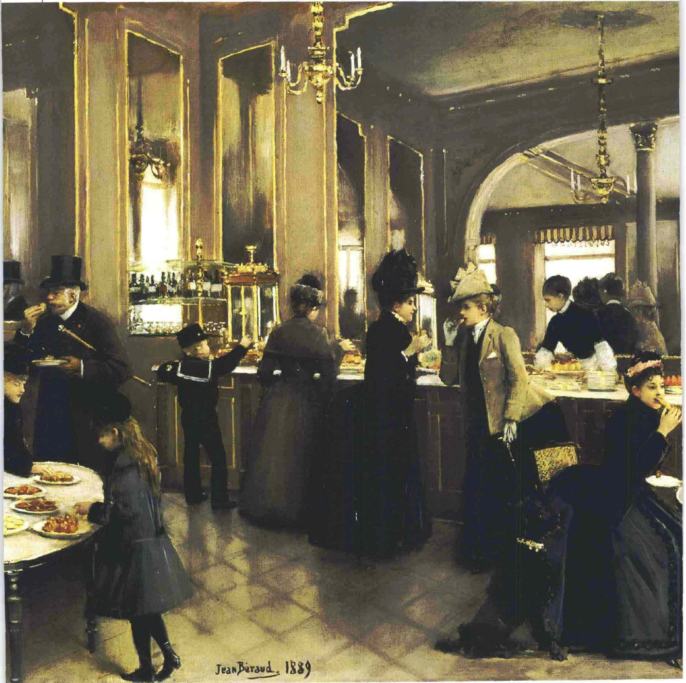
30 Case & Country