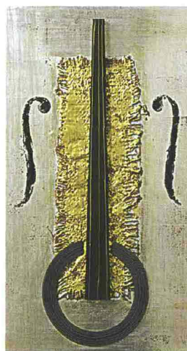
Da sinistra, Still life with glass and fruit, Pablo Picasso, 1939, olio su tela, in mostra a Perugia. Composizione n. 3, 2008, Domenica Regazzoni, collage polimaterico, 40x25x1,8 cm, a Bologna.

de, misteri e qualità di uno dei cibi più apprezzati della storia. Nell'occasione verrà presentato il libro Cioccolato e Piacere a cura di Giuseppe Nisticò (pagg. 136, 50 euro, Spirali Ed.). A Perugia, sede di una delle ditte dolciarie più importanti d'Italia, si svolge, invece, una mostra, curata