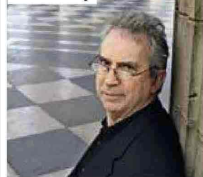
ASO CANNARA / SHACKERPHOTOS

PETER CAREY Parrot and Olivier in America