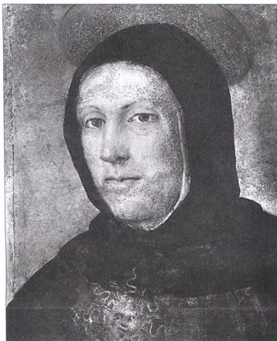
Fra Bartolomeo (1474-1517), «San Tommaso d'Aquino»