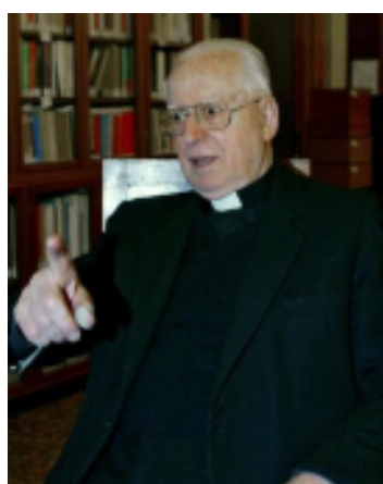
Padre Roberto Busa, gesuita di famiglia altopianese, compie oggi 97 anni

Nella vita si sa dove si comincia, non si sa dove si va a sbattere. È finita che ho fatto il missionario del computer. Il computer era già nato, lavorava su numeri, io sono stato il primo a usarlo su